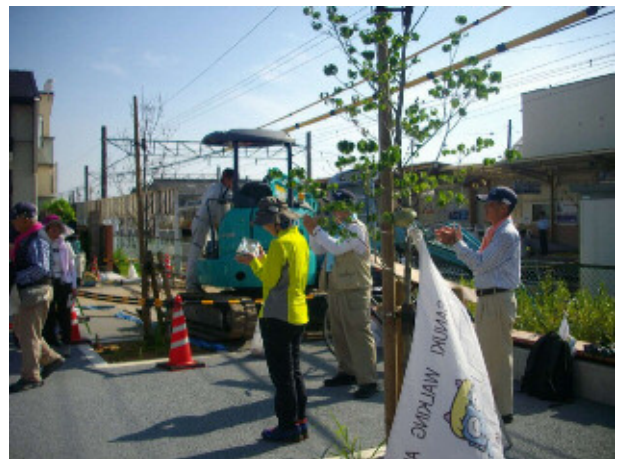
2 150回参加者 表彰