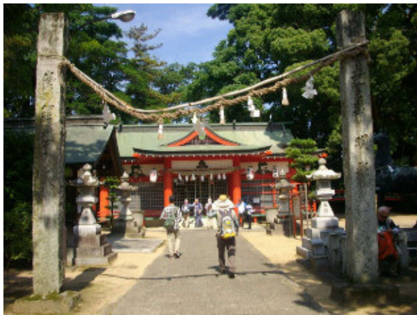
5 廣田八幡神社で休憩