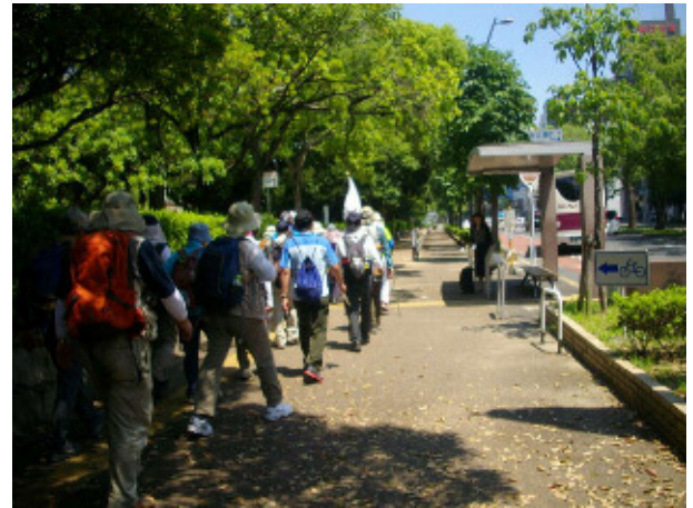
12 中央公園をスタート