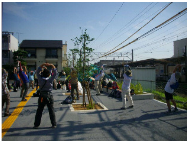
3 仏生山駅 工事中的の新西口改札口で準備体操