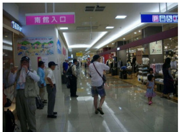
8 youmeタウン建物内で一時の涼をとる