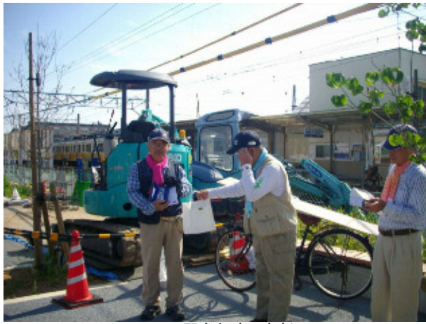
1 200回参加者 表彰