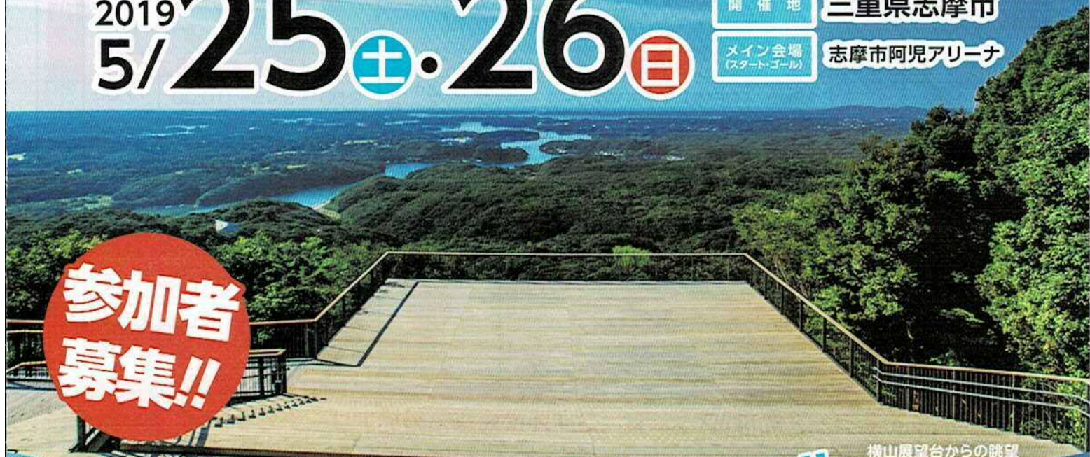
横山展望台からの眺望