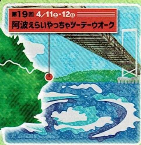
第19回 4/11㉔・12㉔ 阿波えらいやっちゃツデーウォーク