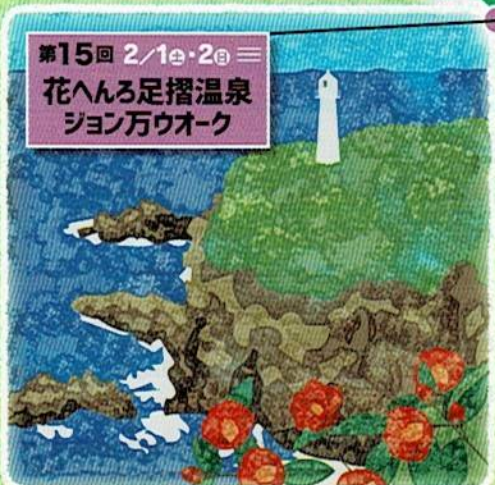
第15回 2/1㉔・2㉔ 三 花へんろ足摺温泉 ジョン万ウォーク