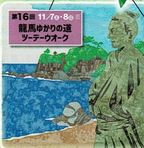
第16回 11/7㉔・8㉔ 三 龍馬ゆかりの道 ツデーウォーク