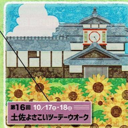
第16回 10/17㉔・18㉔ 三 土佐よさこいツデーウォーク