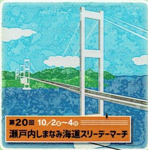
第20回 10/2㉔~4㉔ 瀬戸内しまなみ海道スリーデーマーチ