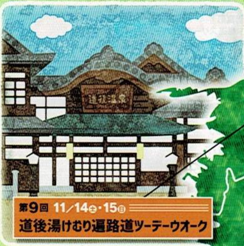
第9回 11/14㉔・15㉔ 道後湯けむり遍路道ツデーウォーク