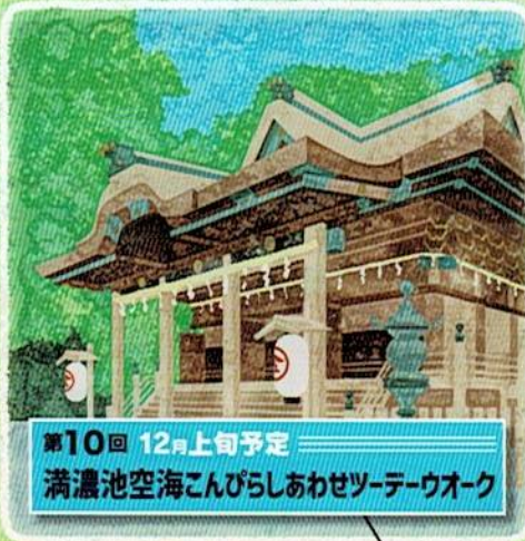
第10回 12月上旬予定 満濃池空海こんびらしあわせツデーウォーク