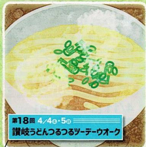
第18回 4/4㉔・5㉔ 讃岐うどんつるつるツデーウォーク