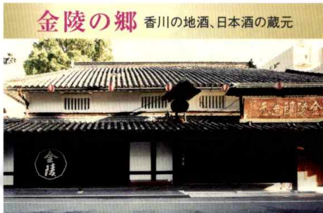
金陵の郷 香川の地酒、日本酒の蔵元

善通寺(ぜんつうじ)は、善通寺市にある真言宗善通寺派の総本山。空海(弘法大師)誕生の地で弘法大師三大霊跡の一つ。807年に真言宗開祖空海の父である佐伯善通を開基として創建された。伽藍は創建地である東院と、空海生誕地とされる西院(御誕生院)に分かれている。四国八十八ヶ所第75番札所。