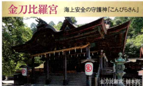
金刀比羅宮 海上安全の守護神「こんびらさん」

仲多度(なかたど)郡まんのう町にある全国で最大級の農業用ため池。大宝年間(701~704)に讃岐国司道守朝臣が築いたとされ、その後決壊を繰り返し、空海(弘法大師)が築池別当として派遣され修築した。満水面積138.5ha、貯水量1,540万立方メートル、周囲は約21km。