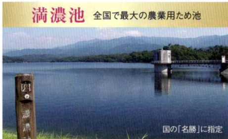
満濃池 全国で最大の農業用ため池