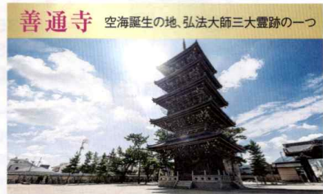
善通寺 空海誕生の地、弘法大師三大霊跡の一つ

金刀比羅宮(ことひらぐう)は、仲多度郡琴平町の象頭山(ぞうずさん)中腹にある神社。祭神は大物主神を主神とし、相殿に崇徳天皇を祀る。海上安全の守護神として信仰され、こんびらさんと呼ばれて親しまれている。本宮展望台からの眺望は讃岐富士(飯野山)や瀬戸大橋が一望できる。